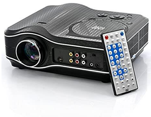
Proyector y reproductor de video

Para clasificar este producto existen dos partidas posibles: